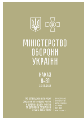
Наказ МОУ № 81 — Порядок списання військового майна у ЗСУ та ДССТ