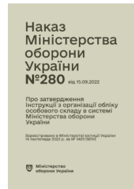
Наказ МОУ № 280 — Інструкція з організації обліку особового складу в системі МОУ