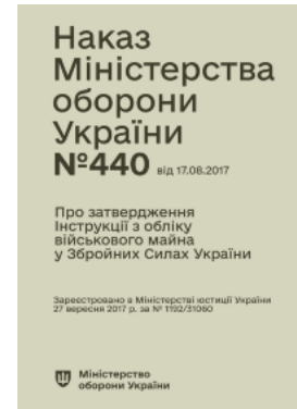
Наказ МОУ № 440 — Інструкція з обліку військового майна у ЗСУ