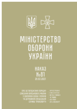
Наказ МОУ № 81 — Порядок списання військового майна у ЗСУ та ДССТ