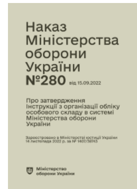
Наказ МОУ № 280 — Інструкція з організації обліку особового складу в системі МОУ