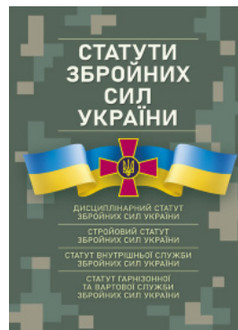
Статути збройних сил України