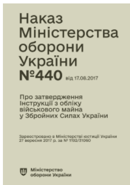
Наказ МОУ № 440 — Інструкція з обліку військового майна у ЗСУ