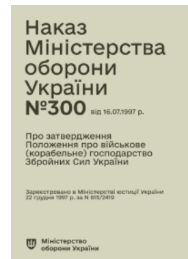
Наказ МОУ № 300 — Положення про військове (корабельне) господарство ЗСУ