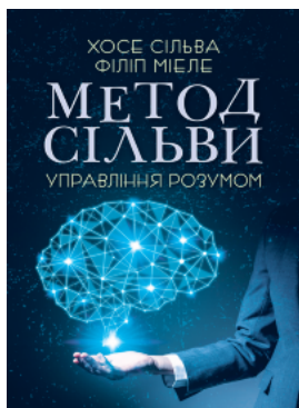
Метод Сільви. Управління розумом