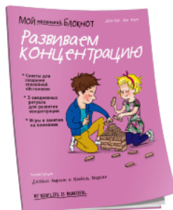
Мой маленький блокнот. Развиваем концентрацию