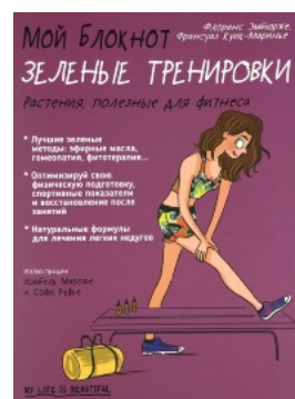
Мой блокнот. Зеленые тренировки