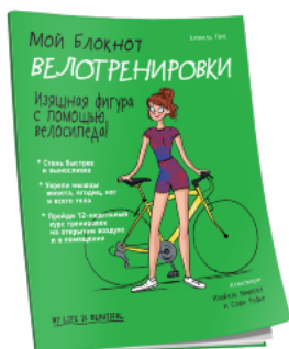
Мой блокнот. Велотренировки