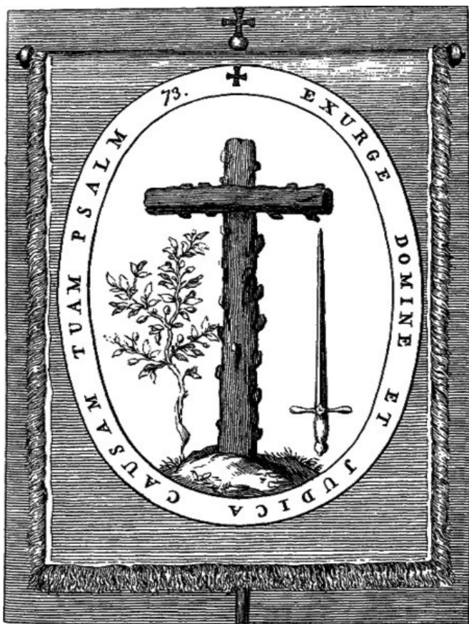
Печать «Священного трибунала» в Испании.

стрига, ламия или маска не существуют и являются бредом одураченных дьяволом отдельных безумцев, совершающих тяжелые насилия над мнимыми преступниками, за что сами должны подлежать ответственности перед законом.