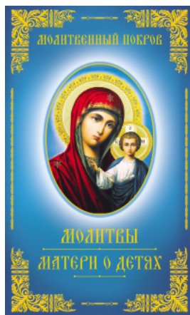
Молитвенный покров. Молитвы матери о детях