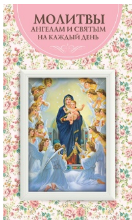
Молитвы ангелам и святым на каждый день