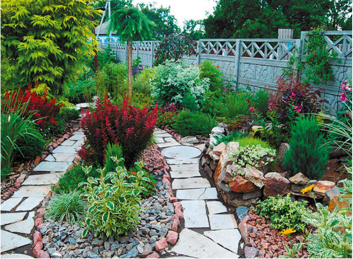
Композиционное решение участка с острым углом в плане в саду Татьяны и Игоря Гречаных