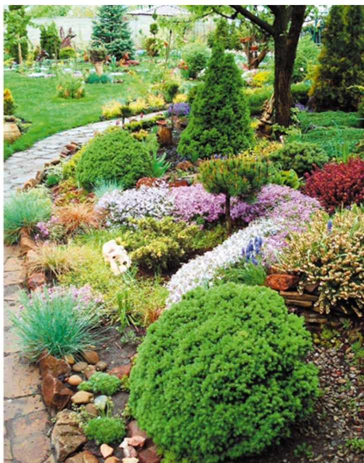
Пример работы с масштабом. Растения уравновешены по массе и гармонируют друг с другом и окружающими деревьями. Сад и фото Татьяны Тертычной