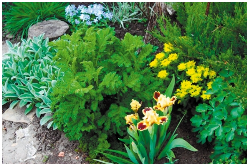
Растения с листьями различной формы и текстуры замечательно дополняют друг друга. Фото и сад Татьяны и Игоря Гречаных

Многие многолетники обладают не только эффектными цветками, но и красивой листвой, декоративной весь сезон, особенно это касается вариегатных, краснолистных и золотистых форм. Такие растения создают цветочные пятна и позволяют избежать монотонности.