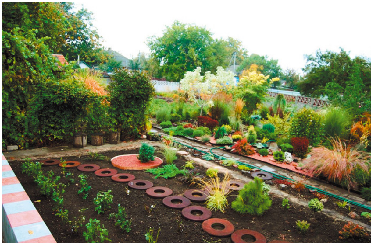
Разбивка нового фрагмента сада. Фото и сад Татьяны и Игоря Гречаных