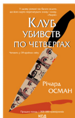
Клуб убивств по четвергах