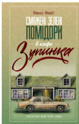
Смажені зелені помідори в кафе «Зупинка»