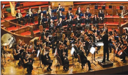
Лондонський симфонічний оркестр. Заснований 1904 р.