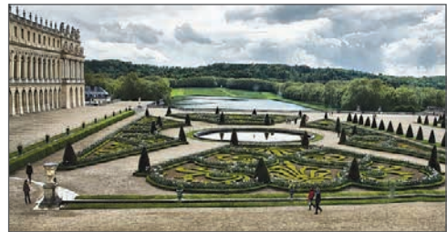
Версальський парк. XVII ст. Франція

Предметами зображення в мистецтві є природні об'єкти, внутрішній світ людини, її почуття, важливі для неї події особистого чи суспільного життя, побут, традиції тощо, а специфічною формою відображення дійсності — художній образ , який виявляє загальне через конкретне, індивідуальне. Тобто, митець творчо переосмислює дійсність і, використовуючи художню мову, способи зображення та засоби виразності