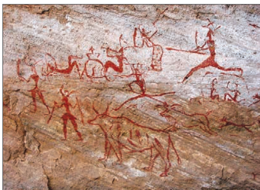
Наскельний малюнок у печері Шове. Бл. 30 тис. років до н. е. Франція

Мистецтво як особливий вид людської діяльності зародилося ще в добу палеоліту. Наші печерні предки, незважаючи на щоденну сувору боротьбу за виживання, захоплювалися красою довкілля, багатством та різноманітністю природних форм і намагалися відтворити їх у рисунках доступними засобами. Давні художники використовували гострі камінці для продряпування на скелях або вуглилки від вогнища, природні мінеральні фарби для контурних чи силуетних зображень тварин на стінах печер. Фарбу наносили пальцями або примітивними пензлями (жмут вовни, пучок трави). Пізніше в наскельних малюнках почали з'являтися зображення людей, багатофігурні композиції — зокрема, сцени полювання. Із глибини віків до нас дійшли й висічені з каменю скульптури тварин, рельєфи, гравюри на кістках і рогах упольованих звірів.