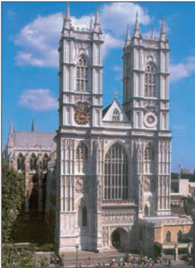
Вестмінстерське абатство. 1245–1745 рр. Лондон

Розгляньте ілюстрації. Які види мистецтва на них зображено? Обґрунтуйте свою думку.