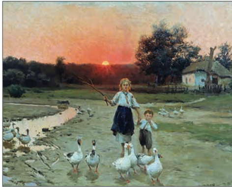
М. Пимоненко. «Вечоріє». 1900 р.