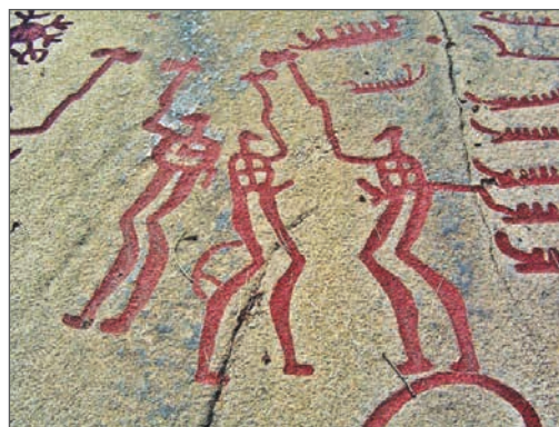
Ритуальний танок. Наскельний рельєф у Танумі. 1700–500 рр. до н. е. Швеція

Окрім цього, стародавні люди знаходили час для ритуальних співів і танців, основу яких складали рухи, що імітували поведінку тварин, мисливські та військові вправи. Подібні заняття для наших предків були водночас і магічним обрядом, і актом пізнання, і засобом передачі досвіду та згуртування колективу.