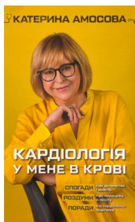
Кардіологія у мене в крові