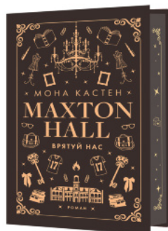
Макстон-хол. Книга 3: Врятуй нас