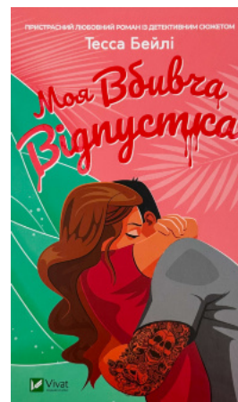
Моя вбивча відпустка