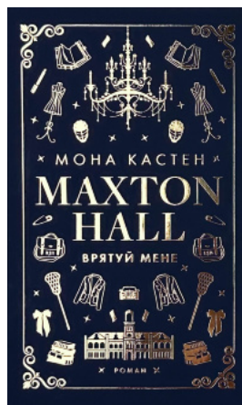
Макстон-хол. Книга 1: Врятуй мене