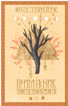
Примівник. Магія мольфарів