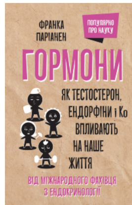
Гормони. Як тестостерон, ендорфіни і Ко впливають на наше життя