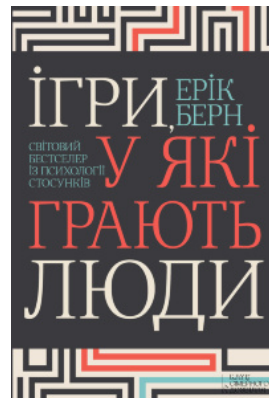
Ігри, у які грають люди