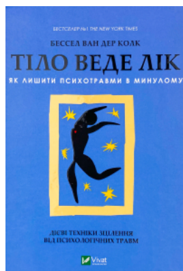
Тіло веде лік. Як лишити психотравми в минулому