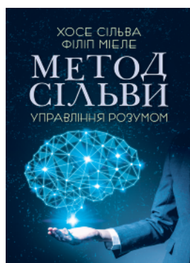
Метод Сільви. Управління розумом