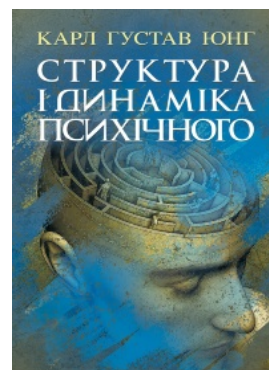
Структура і динаміка психічного