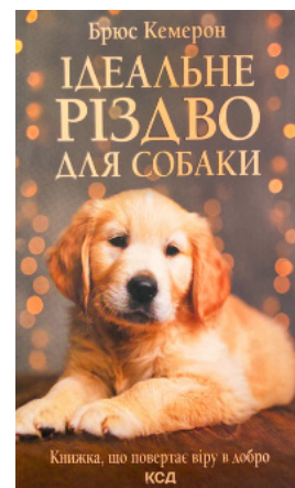
Ідеальне Різдво для собаки