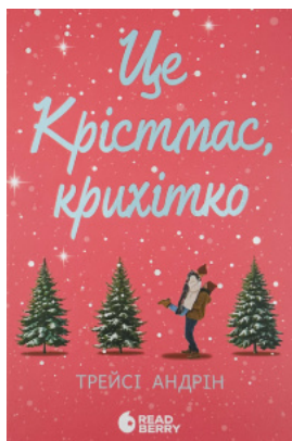
Це Крістмас, крихітко!