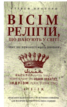
Вісім релігій, що панують у світі: чому їхні відмінності мають значення