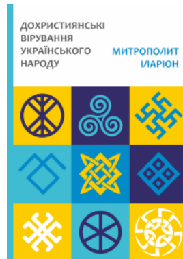
Дохристиянські вірування українського народу