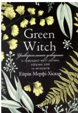
Green Witch. Універсальний довідник із природної магії рослин, ефірних олій та мінералів