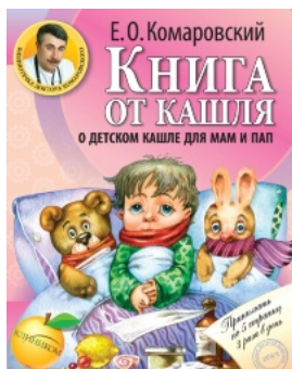
Книга от кашля: о детском кашле для мам и пап