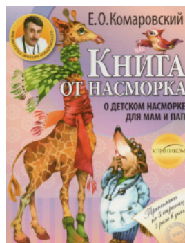
Книга от насморка. О детском насморке для мам и пап