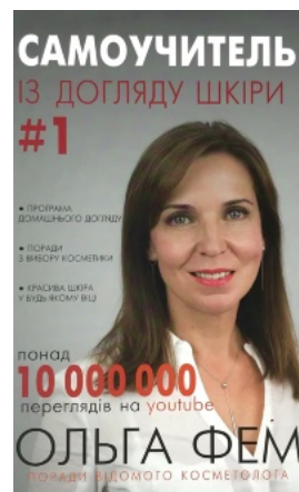
Самоучитель із догляду шкіри #1