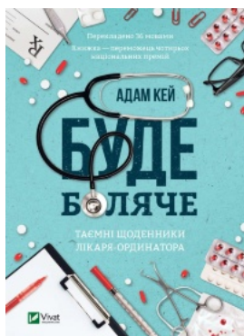
Буде боляче. Таємні щоденники лікаря-ординатора