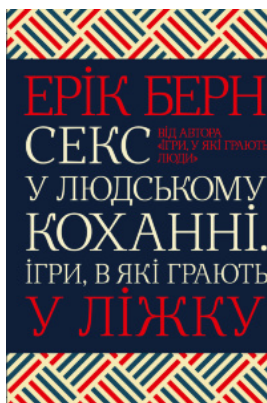
Секс у людському коханні. Ігри, в які грають у ліжку