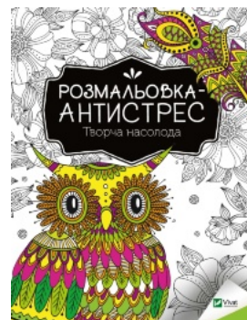
Розмальовка-антистрес с. Творча насолода