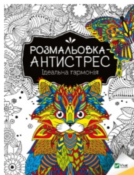
Розмальовка-антистрес с. Ідеальна гармонія