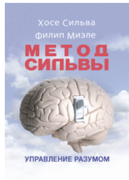
Метод Сильвы. Управление разумом