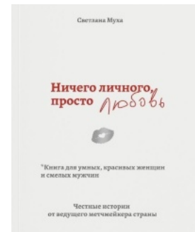
Ничего личного, просто любовь. Книга для умных, красивых женщин и смелых мужчин