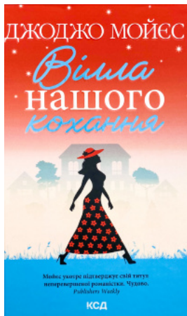
Вілла нашого кохання