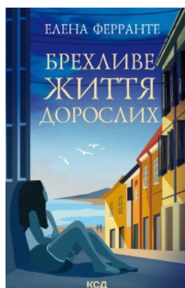
Брехливе життя дорослих