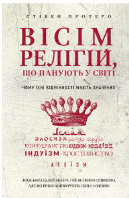
Вісім релігій, що панують у світі. Чому їхні відмінності мають значення