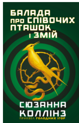
Балада про співочих пташок і змій