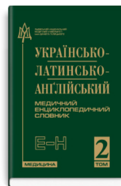
Українсько-латинсько-англійський медичний енциклопедичний словник: у 4 томах. — Том 2. Е—Н