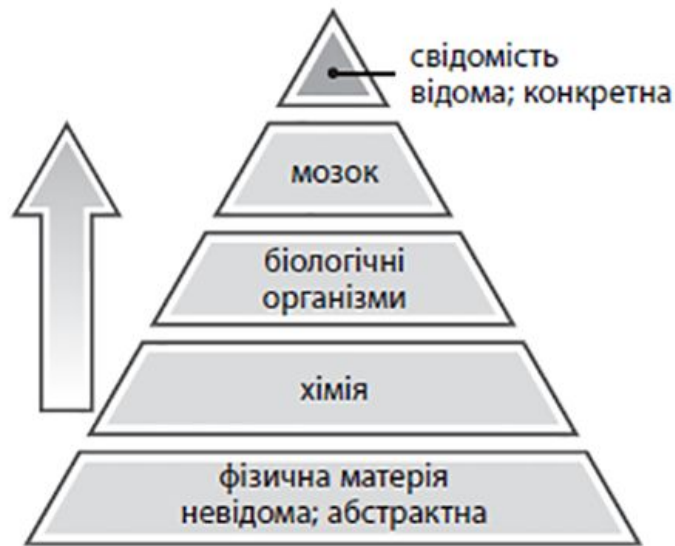
Рис. Б. Матеріалізм стверджує, що матерія, існування якої передує свідомості (невідома абстракція), породжує свідомість (відому та конкретну)

А тепер, зважаючи на вищесказане, знову погляньмо на матеріалізм. Матеріалізм припускає, що першою була матерія і вона породила свідомість. Утім, ми щойно встановили, що існування матерії до свідомості невідоме, тоді як завдяки свідомості воно стає відомим. Отже, матеріалізм твердить: «Нумо використовувати невідому, абстрактну річ, щоб зробити висновок про відому, конкретну річ».