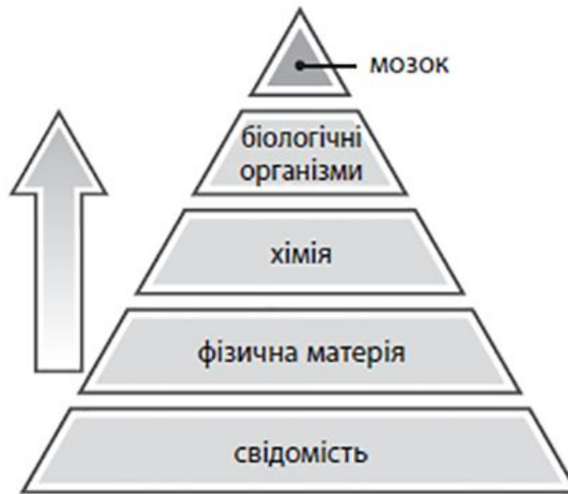
Рис. В. Альтернативний погляд передбачає, що свідомість є фундаментальною, а все інше (наприклад, фізична матерія та всесвіт... і навіть мозок) походить зі свідомості та пізнається завдяки їй

По-своєму сформулював цю ідею англійський філософ Ф. К. С. Шиллер: «Матеріалізм — це наче ставити воза перед конем, втім навіть це можна виправити, просто обернувши зв'язок між матерією та свідомістю. Матерія — це не те, що породжує свідомість, а те, що обмежує її, стримує її силу у певних рамках» 17 [виділено як в оригіналі].