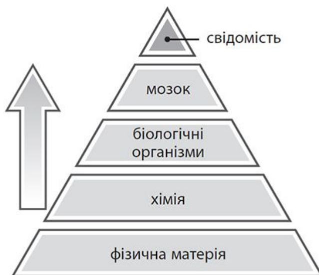
Рис. А. Головний нині науковий погляд, відомий як матеріалізм, полягає в тому, що свідомість породжена мозком, який є продуктом фізичної матерії

Такий спосіб мислення визначає погляди на наше існування. Оскільки матеріалізм припускає, що мозок породжує свідомість, то коли ваш мозок помирає, вмирає і ваша свідомість. Якщо немає мозку, то немає і свідомості. Тому будь-який сенс, який людина приписувала своєму життю, поки була жива, просто зникає, коли людина помирає.