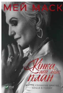
Жінка, яка має план. Життя, сповнене пригод, краси й успіху