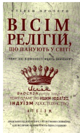
Вісім релігій, що панують у світі: чому їхні відмінності мають значення