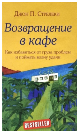
Возвращение в кафе. Как избавиться от груза проблем и поймать волну удачи