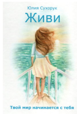
Живи. Твой мир начинается с тебя