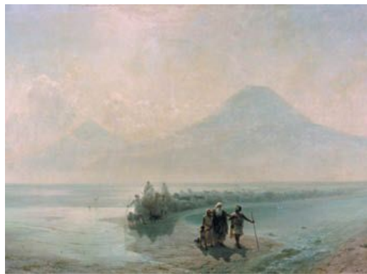
И. К. Айвазовский. Сошествие Ноя с Арарата. XIX в.

7 Вы же плодитесь и размножайтесь, и распространяйтесь по земле, и умножайтесь на ней.