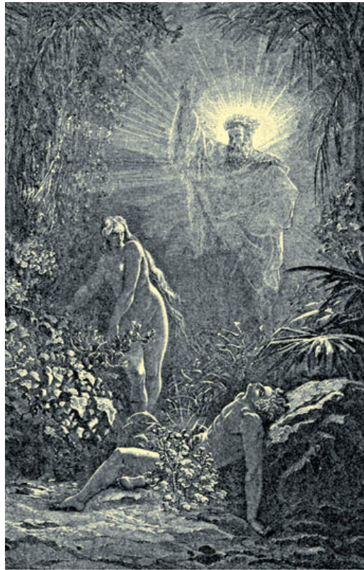
Г. Доре. Сотворение Евы

6 но пар поднимался с земли и орошал все лице земли.