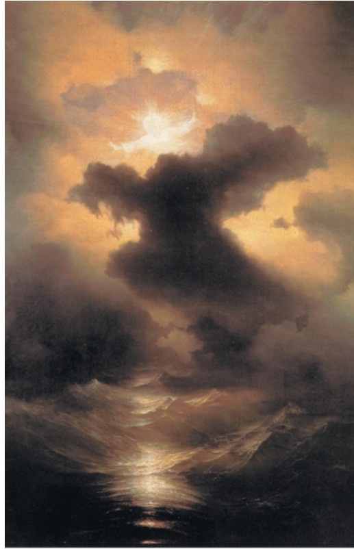
И. К. Айвазовский. Хаос. Сотворение мира. XIX в.

15 и да будут они светильниками на тверди небесной, чтобы светить на землю. И стало так.