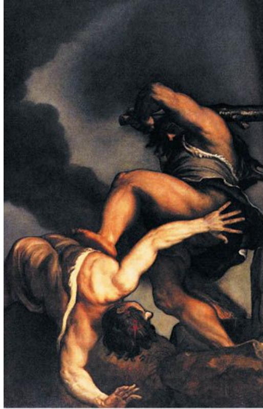
Тициан. Каин и Авель. XVI в. (фрагмент)