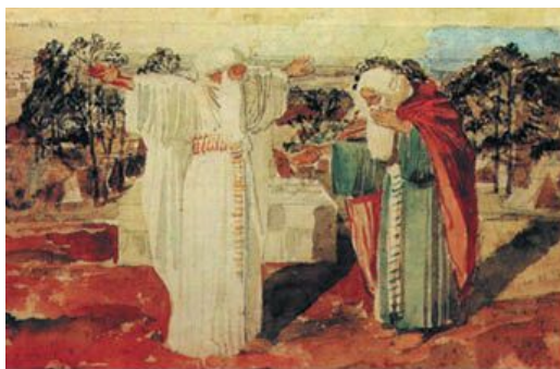
А. А. Иванов. Авраам просит у Бога знамения. XIX в.