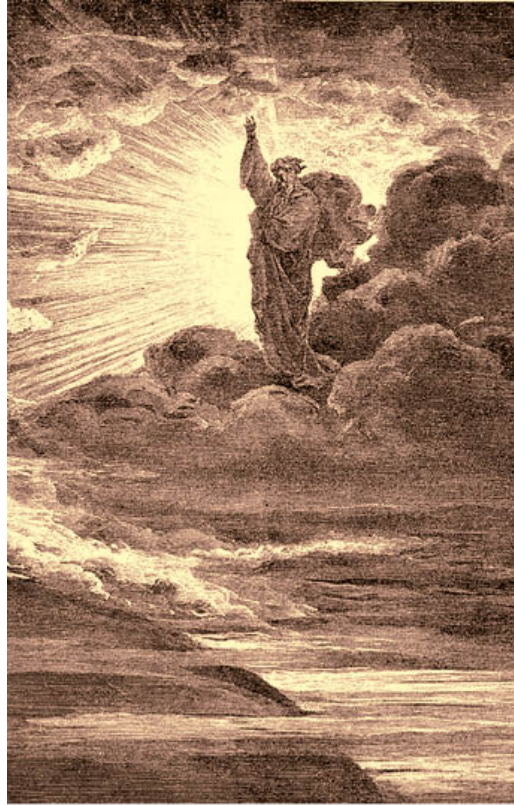
Г. Доре. «И стал свет»