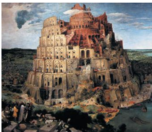
Питер Брейгель Старший. Вавилонская башня. XVI в.

4 И сказали они: построим себе город и башню, высоту до небес; и сделаем себе имя, прежде нежели рассеемся по лицу всей земли.