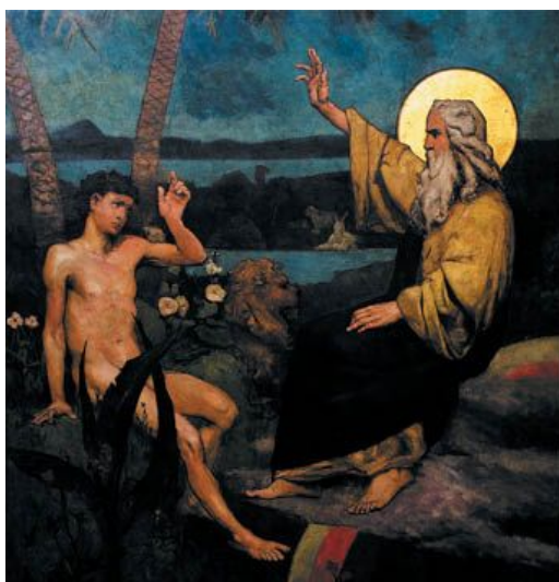
В. А. Котарбинский. Сотворение человека. Завет с Адамом. XIX в.

31 И увидел Бог все, что Он создал, и вот, хорошо весьма. И был вечер, и было утро: день шестый.