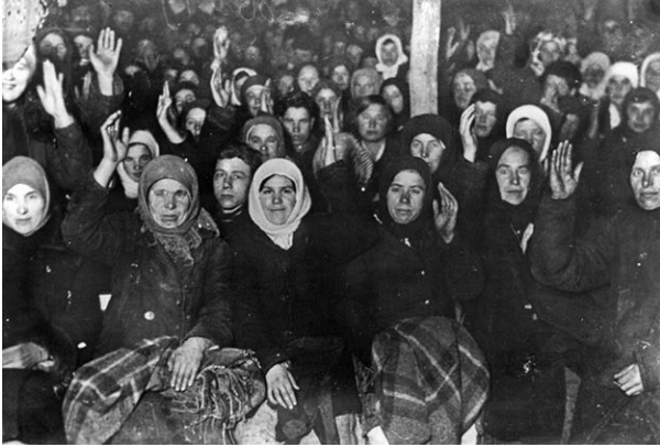
Жінки з колгоспу «Великий перелом» у с. Кругле Сватівського р-ну Луганської обл. голосують на загальних зборах у грудні 1931 р. ЦДКФФА України ім. Г. С. Пшеничного, од. обл. 2–36049

Масштаб загроз і викликів, перед якими постав комуністичний режим на початку 1930-х рр., співмірний з масштабом суспільних перетворень, які ініціював Сталін та його найближче оточення після остаточної перемоги над опозицією. Вони ставили за мету модернізацію відсталого Радянського Союзу задля перетворення країни в потужного гравця на світовій арені, здатного конкурувати з розвинутими західними капіталістичними економіками в економічному та військовому плані. За умови реалізації цього плану, радянський режим міг би претендувати на поширення свого впливу на інші країни. Радянські лідери все ще марили ідеєю світової комуністичної революції та встановлення комуністичного домінування у всьому світі. У цьому контексті політика індустріалізації та колективізації мала ключове значення. Впровадження колективізації в Україні на початку 1930-х рр. відразу зіштовхнулося з величезними труднощами.