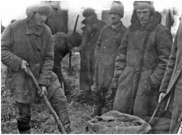
Пошук хліба в одному із сіл Гришинського району Донецької області, 1932 р.

Кримінального кодексу України», тобто геноцид. З історичного погляду це рішення цілком коректне.