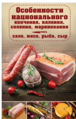
Особенности национального копчения, вяления, соления, маринования. Сало, мясо, рыба, сыр