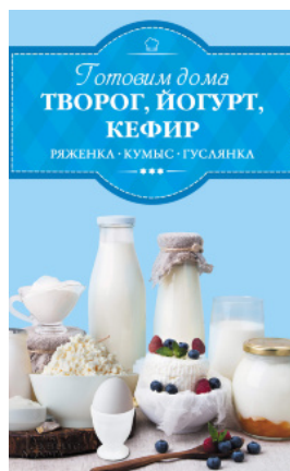
Готовим дома творог, йогурт, кефир, ряженку