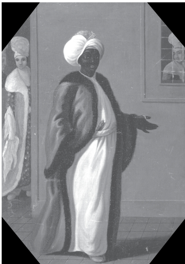
Кизляр-ага султанського гарему. Ф. Сміт. XVIII ст. 54,6 x 38,7 см. Єльський центр британського мистецтва (США)

За султана Мурада III африканські євнухи отримали при дворі чисельну перевагу та найважливішу роботу: наглядати за гаремом. Вважалося, що вони мають міцне здоров'я, тому можуть довго служити султанові. Та й їхня присутність істотно обмежувала можливість інтимних стосунків із наложницями, бо народження у них чорношкірого малюка одразу ж свідчило про адюльтер з євнухами. Білошкірим кастратам довіряли зовнішній периметр гарему й адміністративні покої султана.