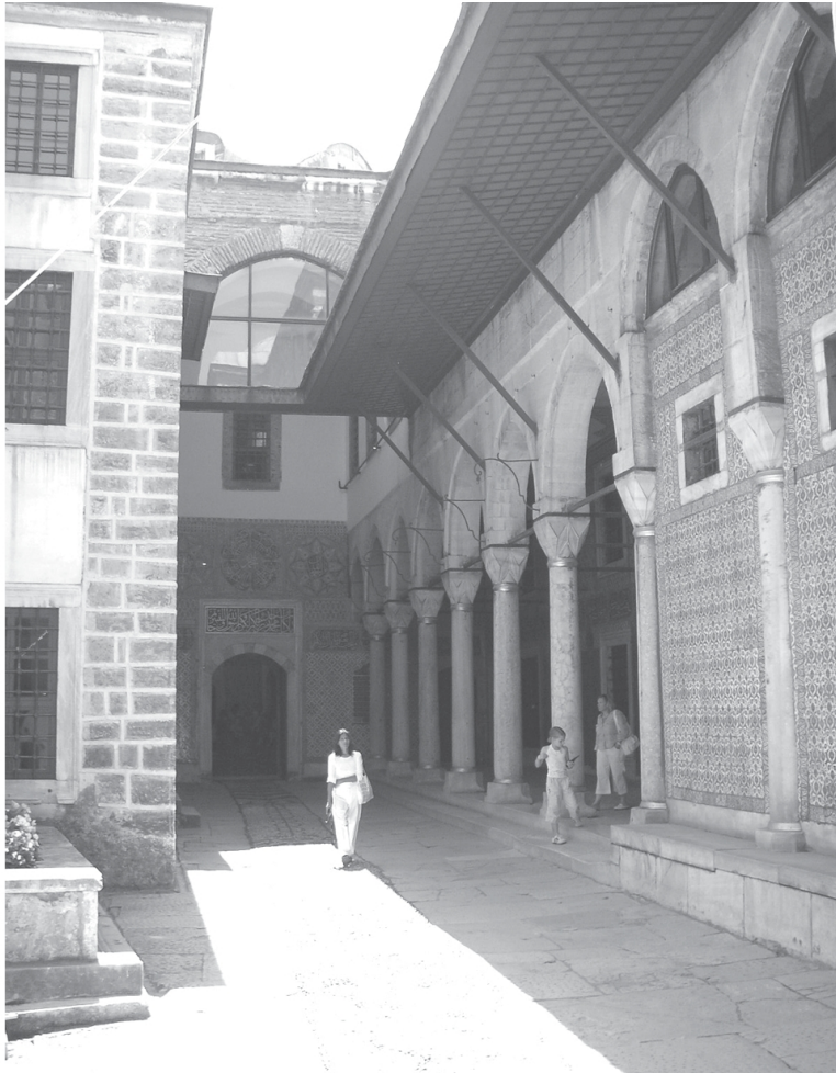
Ташлик (дворик) євнухів Нового палацу (Топкапи)

Загалом, гарем — не будинок розпусти, а складний механізм співіснування султанської родини, зі своєю ієрархією, де найнижчий рівень посідали новенькі рабині — аджеми (у перекладі з турецької — недосвідчені новачки). Їх розміщували в палаці разом з їхніми однолітками в загальних кімнатах гарему, призначених для полонянок. Деякі з цих кімнат були настільки великими, що в них могли перебувати до 100 людей.