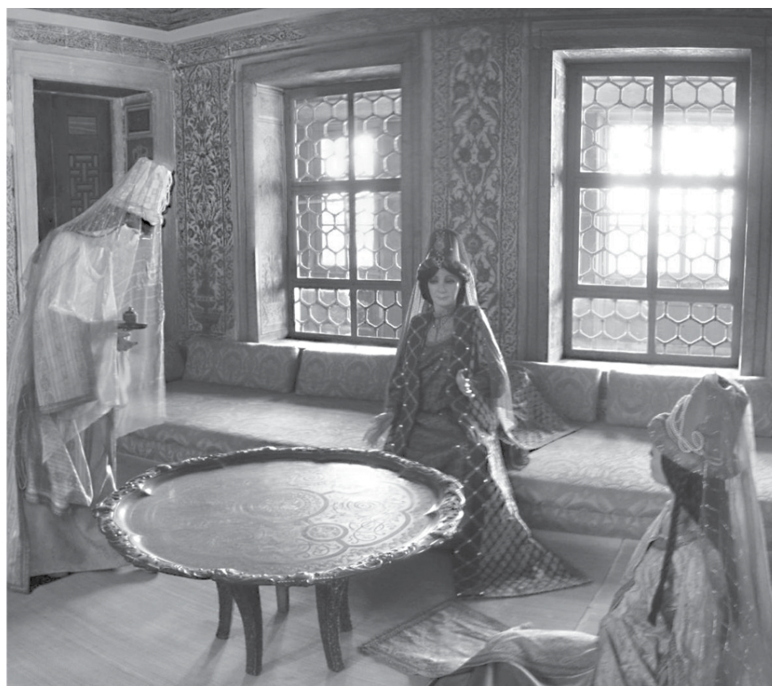
Наложниці з валіде. Інсталяція у гаремі Нового палацу

Утім, життя у Старому палаці було не таким уже й поганим. За свідченнями сучасника Ахмеда І, скарбника британського посольства в Стамбулі Сандерсона, це місце «разом з гарними маєтками, високими фруктовими деревами, лазнями та водограями» нагадувало райський сад. Старий палац, що розміщувався на площі Баязида, із суходолу оточували три, а з моря — дві стіни. До нього вело три брами: зі сходу — ворота Дивану, з півдня — ворота Баязида, а із заходу — Сулейманіє. Двері охороняли по 40 вартових. Усі апартаменти всередині, разом із кімнатами та кухнями, не перетинались, оскільки були розмежовані коридорами. Загалом цей палацовий комплекс складався із 25 будівель.