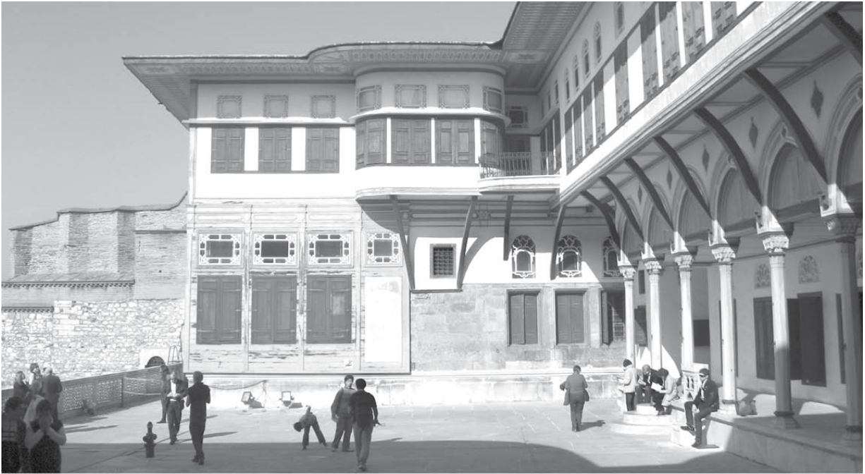
Кімнати фавориток султана в гаремі Нового палацу (Топкапи)

Водночас лікарі оцінювали і психічний стан, і врівноваженість полонянок. Для цього відстежували їхню поведінку навіть уночі: якщо невільниця хропе чи розмовляє уві сні, то її вважали непридатною для султанського гарему.