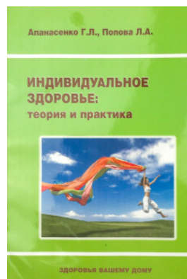
Індивідуальне здоров'я: теорія і практика