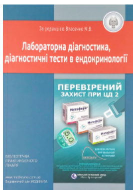
Лабораторна діагностика, діагностичні тести в ендокринології