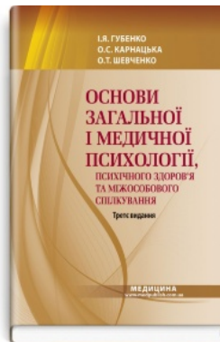
Основи загальної і медичної психології, психічного здоров'я та міжособового спілкування: підручник