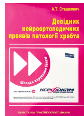
Довідник нейроортопедичних проявів патології хребта

Перейти до категорії Охорона здоров'я. Гігієна