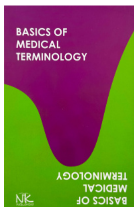
Basics of Medical Terminology