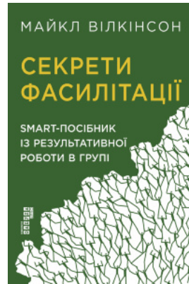
Секрети фасилітації. SMART-посібник із результативної роботи в групі