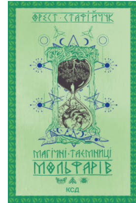
Магічні таємниці мольфарів