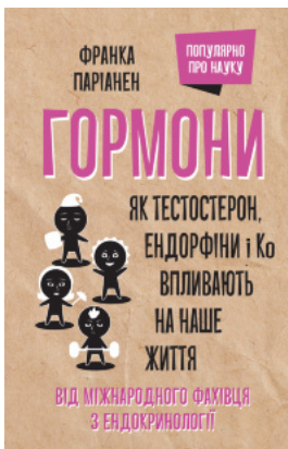
Гормони. Як тестостерон, ендорфіни і Ко впливають на наше життя