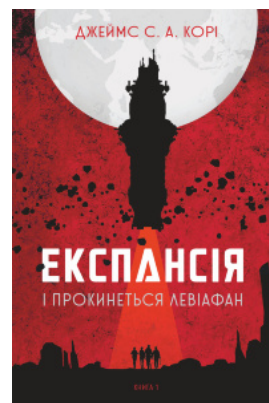
Експансія. Кн. 1