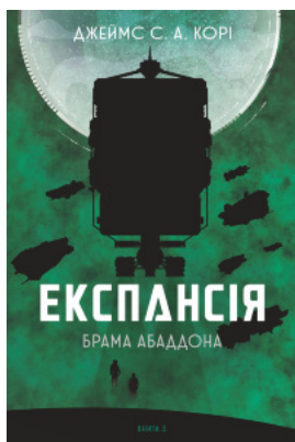
Експансія. Кн. 3