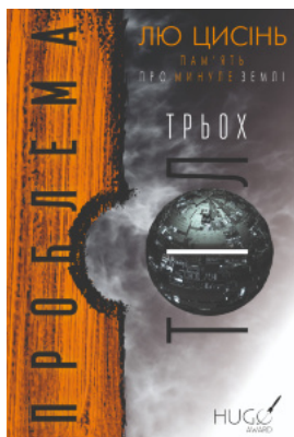
Проблема трьох тіл