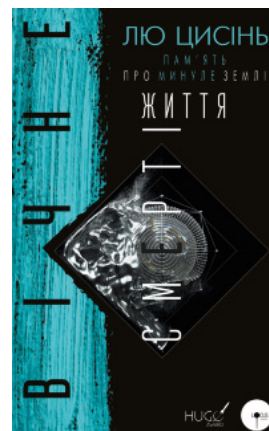
Вічне життя Смерті