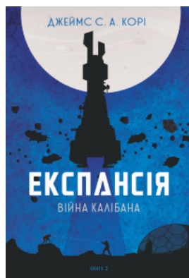
Експансія. Кн. 2