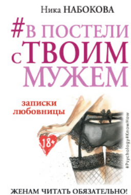
#В постели с твоим мужем. Записки любовницы. Женам читать обязательно!

Перейти до категорії Аналітична психологія