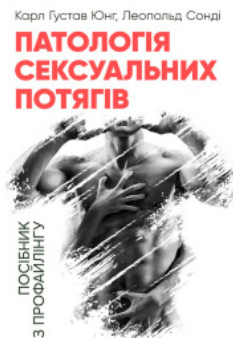
Патологія сексуальних потягів. Посібник з профайлінгу