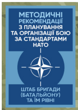
Методичні рекомендації з планування та організації бою за стандартами НАТО (штаб бригади (батальйону) та їм рівних)