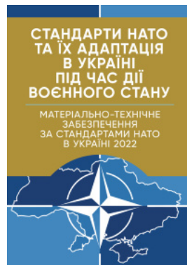
Стандарти НАТО та їх адаптація в Україні під час дії воєнного стану. Матеріально-технічне забезпечення за стандартами НАТО в Україні 2022...