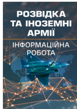
Розвідка та іноземні армії. Інформаційна робота