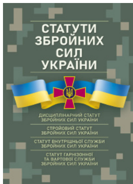
Статути збройних сил України