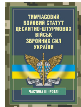
Тимчасовий бойовий статут Десантно-штурмових військ Збройних Сил України, частина III (рота)