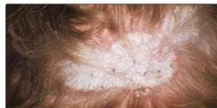
Рис. 17.4. Лускаті бляшки псоріаза на шкірі голови з локальним випадінням волосся

Псоріатична хвороба суглобів трапляється у 20–30 % пацієнтів із псоріазом і пов'язана з тяжким перебігом уражен-