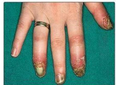
Рис. 18.3. Варіант псоріазу – акродерматит Алоппо. На трьох пальцях наявні стерильні пустулярні зміни з дактилітом

Препарат приймають один раз на тиждень перорально у вигляді одноразової дози (зазвичай 7,5–15 мг), хоча його можна вводити підшкірно або внутрішньом'язово. Перед початком лікування метотрексатом необхідно підтвердити дані щодо нормального функціонування печінки, нирок і кісткового мозку, і ці функції слід контролювати під час лікування.