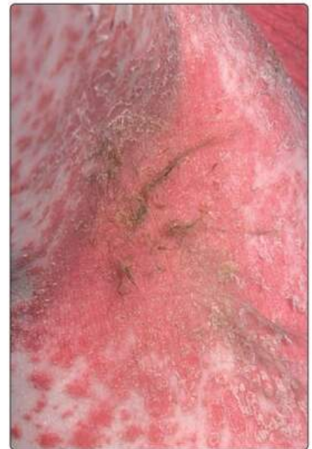
Рис. 17.1. Псоріаз пахової западини з еритематозними бляшками з лущенням. Зовнішній вигляд може нагадувати себорейний дерматит.

Дистиляти кам'яновугільного дьогтю десятиліттями використовують для лікування псоріазу. Вони безпечні та, схоже, діють шляхом інгібування синтезу ДНК. Головні недоліки дьогтю: неприємний запах і бруд. Незважаючи на це, він може бути корисним для стаціонарного лікування, наприклад у поєднанні з ультрафіолетом В – схема Гекермана. Рафінований дьоготь (1–10 %) доступний у формі крему або лосьйону для амбулаторного застосування (напри-