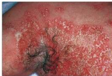
Рис. 18.2. Генералізований пустульозний псоріаз. У зоні еритеми є численні пустули, які місцями об'єднуються, утворюючи осередки гною.

Якщо є відповідність критеріям, необхідним для початку системного лікування, зазвичай насамперед розглядають можливість застосування метотрексату, перш ніж переходити до інших системних засобів. Цей метод розглядають за умови відсутності протипоказань до застосування метотрексату та конкретних вказівок щодо використання інших препаратів як системного препарату першої лінії.