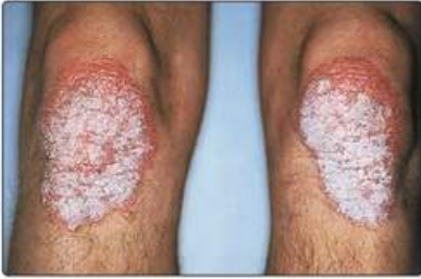
Рис. 16.3. Типові лускаті бляшки псоріазу на колінах