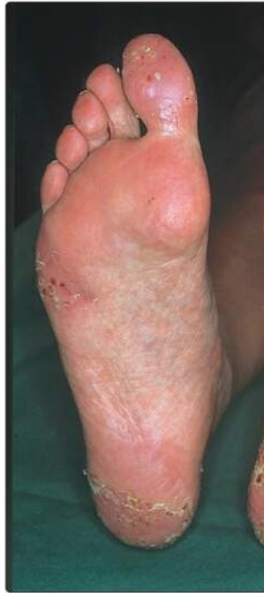
Рис. 18.5. Долонно-підшовний пустульоз із жовтими пустулами на великому пальці, п'яті та бічній поверхні передньої частини стопи. Наявне пов'язане з цим лущіння. (Взято з Gawkrödger D.J., 2004. Rapid Reference Dermatology . Mosby, з дозволу)

Циклоспорин, імуносупресант, який широко використовують для запобігання відторгненню трансплантованих органів,