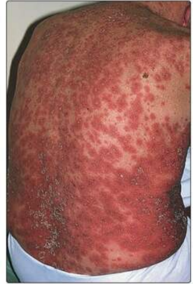
Рис. 16.7. Генералізований пустульозний псоріаз у пацієнта похилого віку