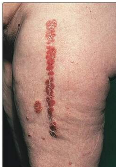
Рис. 16.2. Феномен Кебнера. Псоріаз розвинувся в хірургічному рубці.

Епідерміс стовщується при збереженні кератиноцитів ядер (див. рис. 16.1).