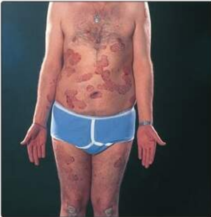
Рис. 18.4. Хронічний бляшкоподібний псоріаз на тулубі.

Захворювання печінки, алкоголізм і гостра інфекція є протипоказаннями до використання метотрексату, тому слід уникати можливої взаємодії лікарських засобів (наприклад з аспірином, нестероїдними протизапальними засобами або ко-тримоксазолом). Поліпшення стану спостерігається через 2–4 тиж.