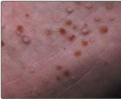
Рис. 16.6. Долонно-підшовний пустульоз: локалізований варіант псоріазу на підшві стопи