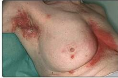
Рис. 16.5. Гладке, незроговіле ураження при псоріазі розгинальних поверхонь