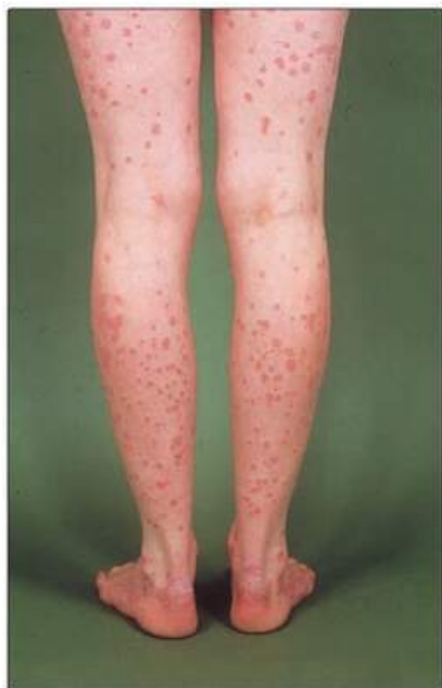
Рис. 17.3. Краплеподібний псоріаз на нижніх кінцівках.

клад Ехогех, Psoriderm). Ці препарати придатні для лікування хронічного бляшкоподібного або краплеподібного псоріаза після завершення гострої фази (рис. 17.3).