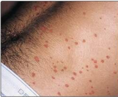
Рис. 16.4. Краплеподібні ураження при краплеподібному псоріазі