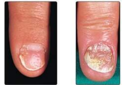
Рис. 16.8. Ураження нігтів при псоріазі: виїмки (ліворуч) і піднігтьовий гіперкератоз з оніхолизисом (праворуч)

Псоріаз уражує матрикс або нігтьове ложе у 25–50 % випадків (рис. 16.8). Найчастішою зміною є поява «наперсткоподібної» виїмки, за якою слідує оніхолизис (відокремлення дистального краю