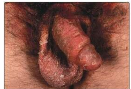
Рис. 17.2. Псоріаз згинальних поверхонь чоловічих статевих органів. (Взято з Vollognia J.L., Jorizzo J.L., Schaffer J.V., 2012. Dermatology , 3rd edn. Saunders, з дозволу)