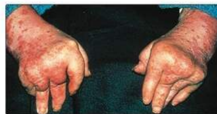
Рис. 17.5. Тяжкий деформівний симетричний артрит із поширеним псоріазом

ня шкіри. Захворювання на псоріатичну артропатію демонструє рівне співвідношення статей і має три форми: