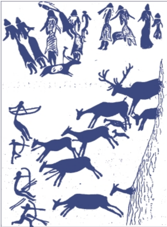
Піктографічне письмо здорової первісної людини