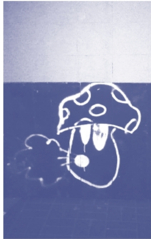
Піктографічне письмо куруця з Куренівки

Звісно, ви чули про наскельні малюнки, які сягають тисяч років у минуле. В Україні вони теж є — у скелях Кам'яної Могили на Запоріжжі. Такі зображення називаються петрогліфами , але не від імені вашого сусіда Петра, який, безперечно, нагадує первісну людину, а від грецького петрос — «камінь». Учені стверджують, що скрізь, де колись жила людина і де був камінь, можна натрапити на такі давні письмена.