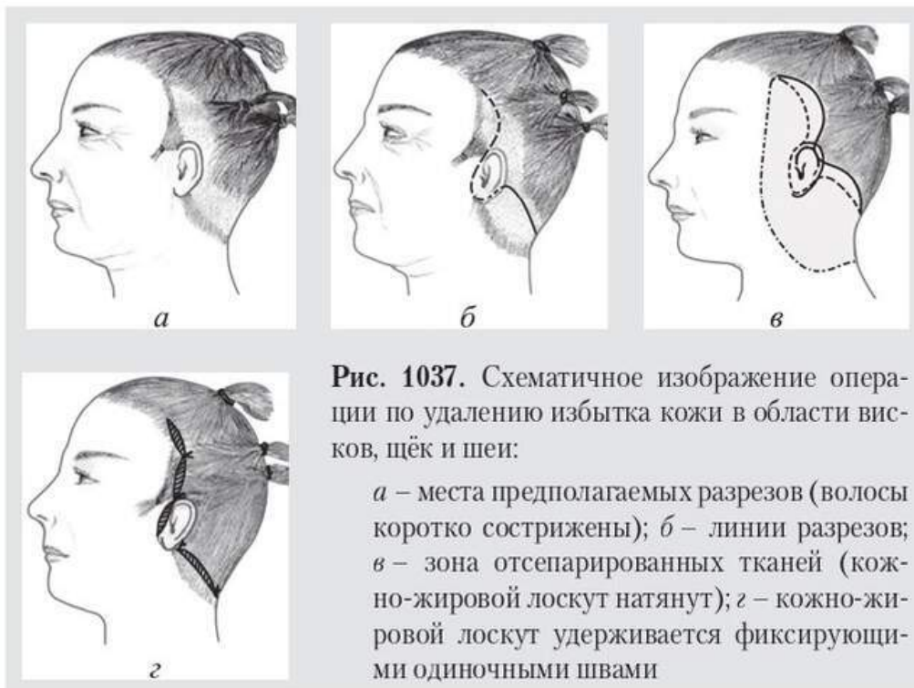
Рис. 1037. Схематичное изображение операции по удалению избытка кожи в области висков, щёк и шеи:

Операцию выполняют последовательно на каждой стороне лица. Разрез кожи начинают в височной области и опускают его до верхнего края ушной раковины, а затем, плавно огибая ушную раковину (впереди козелка и вокруг уха), продолжают по заушной складке до сосцевидного отростка с поворотом на шею. Отслаивают кожно-жировой лоскут. В верхних отделах лица отслойку лоскута следует проводить более щадяще, чем в нижних (на шее кожу можно отслаивать до средней линии). Делают гемостаз. Кожу натягивают (мобилизуют) вверх и кзади так, чтобы на лице и шее все складки расправились. Избытки кожи иссекают. Кожно-жировой лоскут удерживают в заданном положении фиксирующими одиночными швами. Послеоперационную рану ушивают непрерывными или одиночными швами из нерассасывающихся нитей. Накладывают циркулярную бинтовую давящую повязку на 3–4 дня. Швы снимают на