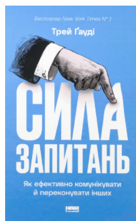
Сила запитань. Як ефективно комунікувати та переконувати інших