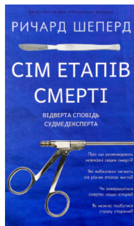
Сім етапів смерті. Відверта сповідь судмедексперта

Перейти до категорії Біографії і мемуари