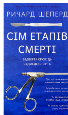
Сім етапів смерті. Відверта сповідь судмедексперта

Перейти до категорії Біографії і мемуари