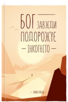
Бог завжди подорожує інкогніто