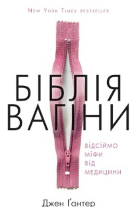
Біблія вагіни. Відсіймо міфи від медицини!