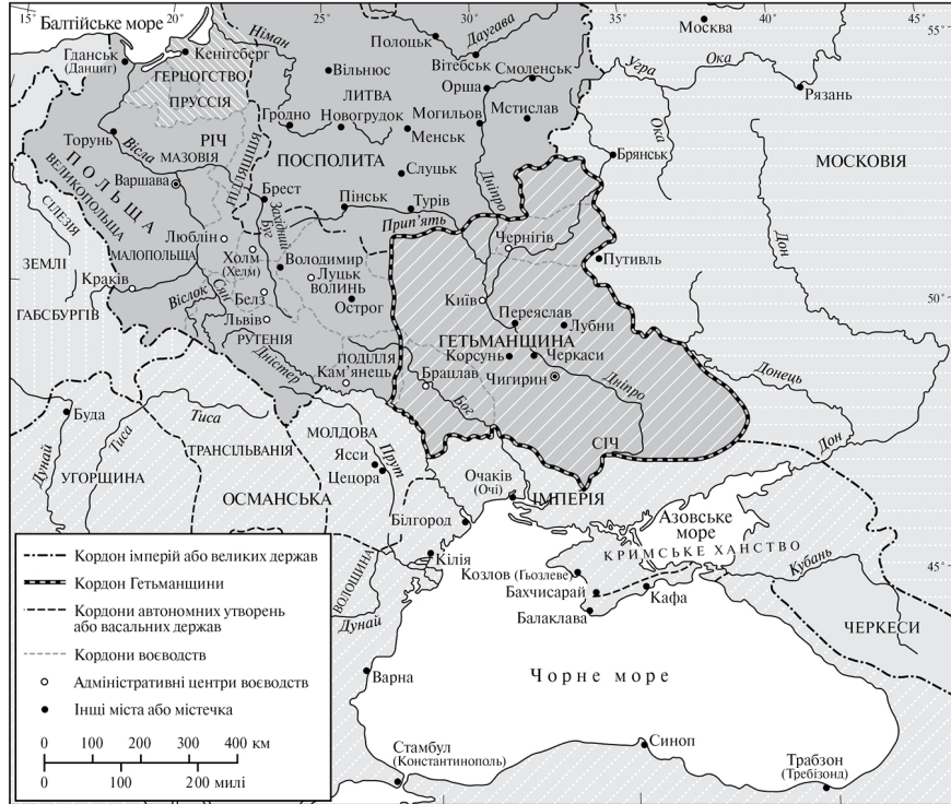
Рис. 6. Козацька Україна близько 1650 р.