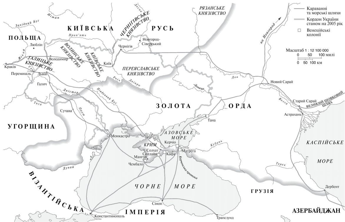
Рис. 4. Золота Орда близько 1300 р.