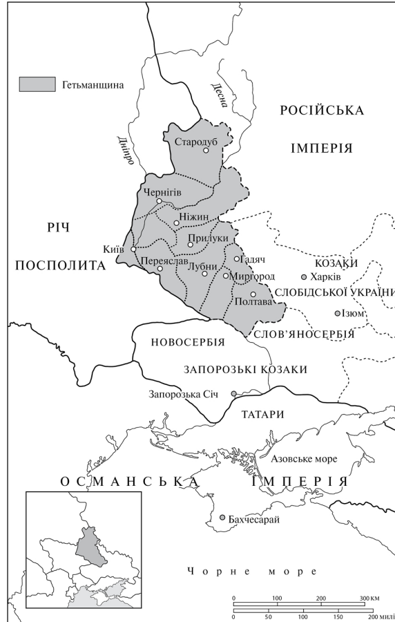
Рис. 7. Гетьманщина та навколишні території в 1750-х рр.

Джерело: Zenon E. Kohut, Russian Centralism and Ukrainian Autonomy: Imperial Absorption of the Hetmanate, 1760s—1830s (Cambridge, MA: Harvard University Press, 1988), p. xiv.