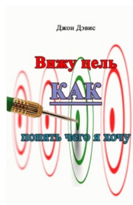
Вижу цель. Как понять, чего я хочу