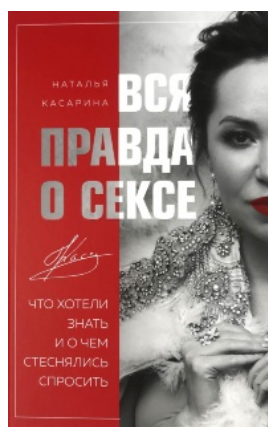
Вся правда о сексе. Что хотели знать и о чем стеснялись спросить