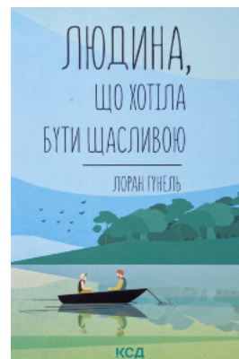
Людина, що хотіла бути щасливою