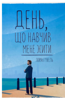
День, що навчив мене жити