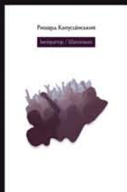
Ришард Капусцінський ІМПЕРАТОР. ШАХІНШАХ

Інтелектуал, який у наші дні, після стількох історичних прикладів, словом чи ділом підтримує тоталітарний режим або сповідує тоталітарні ідеї, – це для мене якийсь нонсенс, contradictio in adjecto . Про біду можна собі уявити землероба, пролетаря чи там урку, який досі плакає ілюзії, що панування його нації, класу чи клану буде для нього вигідним. Але інтелектуал, який таврує ліберальну демократію, виступає тим самим проти «ринкової площі слова», тобто єдиного місця, де він вповні може бути вільним інтелектуалом, і накликає на свою голову котрийсь із тих режимів – байдуже, комуністичний, нацистський чи уркаганський, – за яких вільні інтелектуали зустрічаються хіба що у в'язницях. Ні, все-таки люди «простіші» рідко доходять до таких самогубчих фантазій. Принаймні якось мені не доводилося чути, щоб футболісти виступали проти стадіонів, сантехніки – проти унітазів чи кишенькові злодії – проти грошей. А інтелектуали проти підстав власного існування – потраплять.