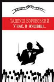
Тадеуш Боровський У НАС, В АУШВІЦІ...