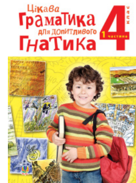
Цікава граматика для допитливого Гнатика: посібник для поглибленого вивчення української мови : 4 кл.: у 2-х ч. Ч. 1