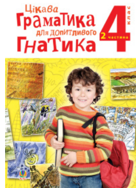
Цікава граматика для допитливого Гнатика: посібник для поглибленого вивчення української мови: 4 кл.: у 2-х ч. Ч.2