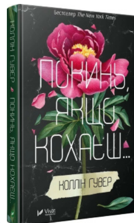
Покинь якщо кохаєш