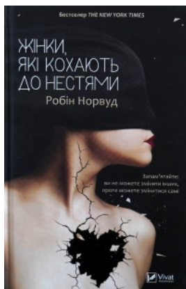
Жінки, які кохають до нестями