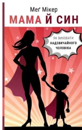
Мама й син. Як виховати надзвичайного чоловіка